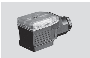
信号转换器 MUW ... , 一体化接头, 工作电压 24V, 标准信号输出