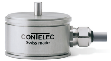
Vert-X 51 配件(incl.) 3x 固定夹子 3x带槽汽缸盖 螺丝M3x8